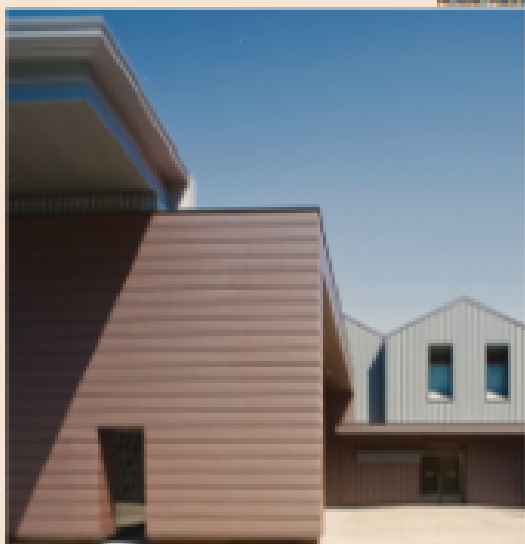
Trasversale. La Cantina Santa Margherita (sopra); la residenza di viale Montegrappa a Milano (a fianco); il progetto per la nuova sede del gruppo francese Castel in Etiopia.